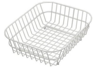
Weißer Korb 8612 100