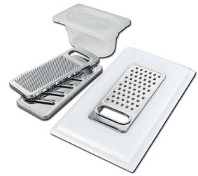
Satz Reibe mit Halterung für Ring und Auffangschale 8159 101 * nur in Kombination mit dem Zubehör 8100 627