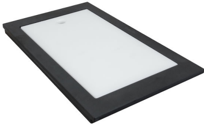
Schneidebrett Twin HDPE + Black 8100 627