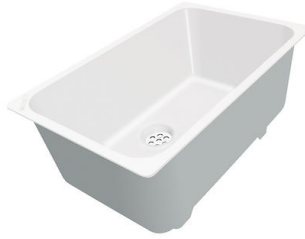
Weiße Wanne 8153 100