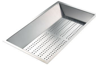
Perforierte Edelstahlwanne 8151 000 * nur in Kombination mit dem Zubehör 8100 627