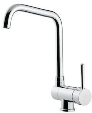
Mischbatterie Drop 8523 000